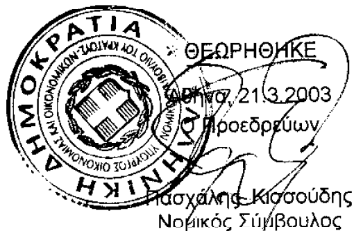
Πασχάλης Κισσούδης Νομικός Σύμβουλος

III. Εν όψει των όσων προεκτέθηκαν, συνεπώς, το Τμήμα, κατά πλειοψηφία, γνωμοδοτεί ότι η υπηρεσιακή κατάσταση των υπαλλήλων που είναι απόφοιτοι της Εθνικής Σχολής Δημόσιας Διοίκησης και διορίζονται μέσω διαγωνισμών του Α.Σ.Ε.Π. σε κενές οργανικές θέσεις άλλων υπηρεσιών διαφορετικών από εκείνες στις οποίες είχαν τοποθετηθεί μετά την αποφοίτηση από την Σχολή, εξακολουθεί να διέπεται από τις ισχύουσες ειδικές γι' αυτούς διατάξεις και όχι από αυτές που ισχύουν για τους δημοσίους υπαλλήλους γενικά, παρά την αυτοδίκαιη λύση της αρχικής υπαλληλικής σχέσης που συνεπάγεται η αποδοχή του νέου διορισμού.